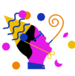
RTL Events & Partys