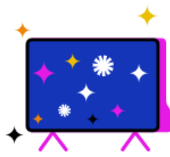
Kostenfreier Zugang zu RTL+