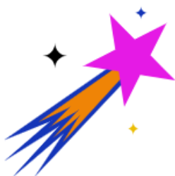
Förderung von Talenten