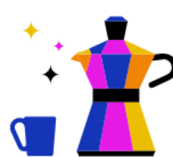
Kantine & Café- Bar