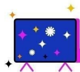
Kostenfreier Zugang zu RTL+