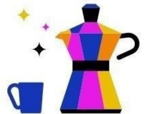
Kantine & Café- Bar