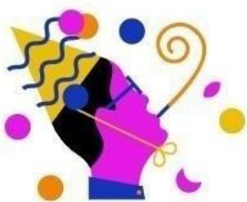
RTL Events & Partys