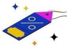
Mitarbeiter- Angebote & - Rabatte