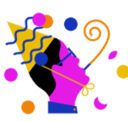
RTL Events & Partys