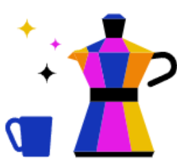
Kantine & Café- Bar