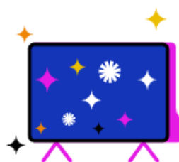
Kostenfreier Zugang zu RTL+