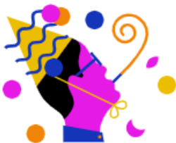
RTL Events & Partys