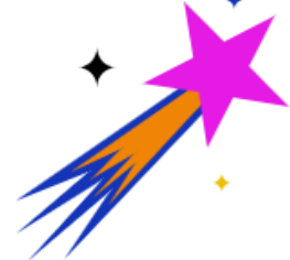
Förderung von Talenten