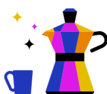
Kantine & Café- Bar