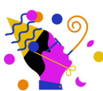
RTL Events & Partys